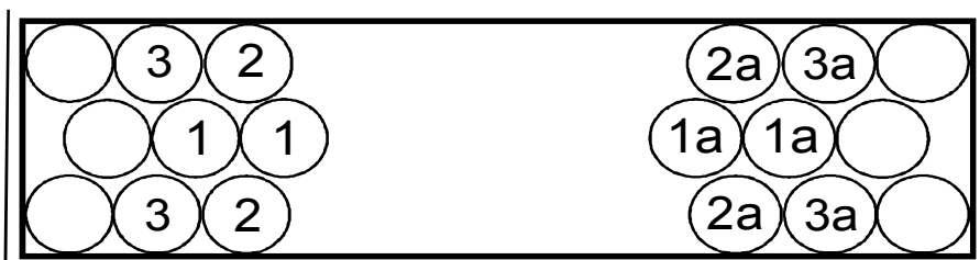
Рис.1 Верхний ярус